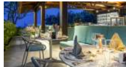
POSEIDON A'LA CARTE RESTAURANT