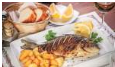
POSEIDON A'LA CARTE RESTAURANT