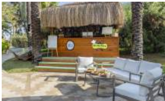
THE DELI TOAST (Toast-Sorten)