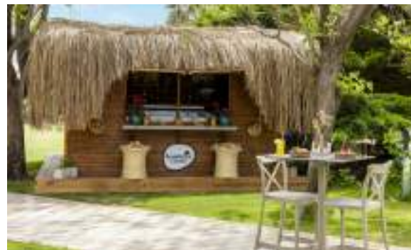
KUMPIR CORNER (Typen von Kumpir)