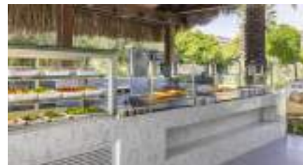
NEYZEN CAFE & RESTAURANT

Gözleme-Sorten, Çi Börek, Obst und Speiseeis