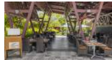
DAFNE A'LA CARTE RESTAURANT

Gözleme-Sorten, Çi Börek, Obst und Speiseeis