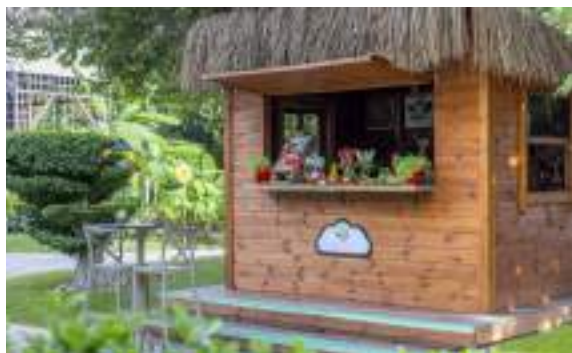
FIT & WELLNESS (Gesunde Snacks)